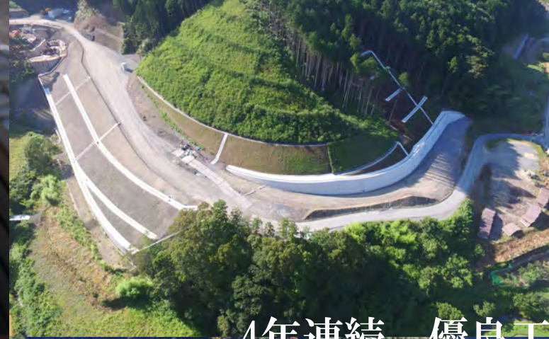
【平成29年度】国交省優良工事表彰