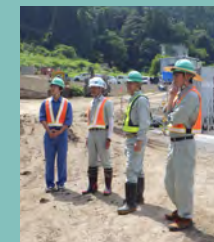
2018年 インターンシップ

僕は高知高専で勉強をしているうちに土木の仕事に興味を持つようになりました。土木の仕事は橋や道をつくると、自分の仕事の成果が目に見えるので、達成感があります。そこに魅かれて入社しました。僕は入社してすぐ四万十町興津の道路改良の現場へ行くことになりましたが、先輩が丁寧に教えてくれるおかげで、とても有意義な日々を過ごしています。