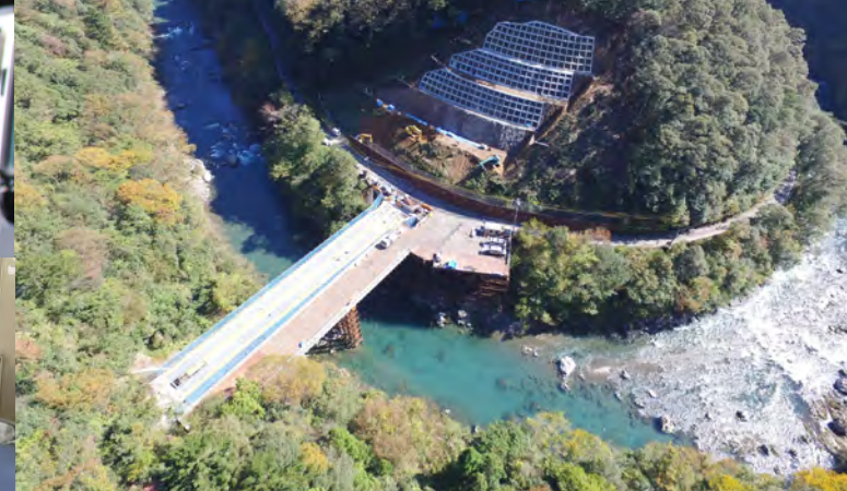
【平成30年度】高知県須崎土木事務所長表彰