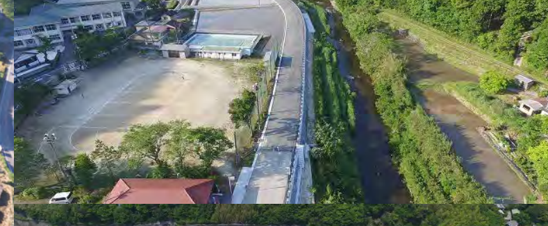
【平成28年度】高知県優良建設工事表彰